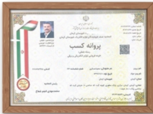
مجوز طراحی و فروش تجهیزات نیروگاه خورشیدی