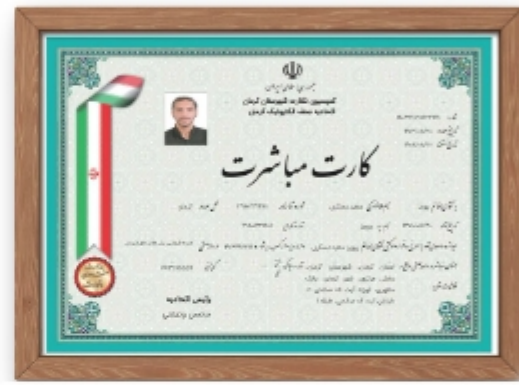
مجوز خرده فروشی پنل های خورشیدی