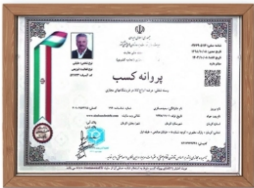
مجوز عرضه انواع کالای برقی در فروشگاه های مجازی