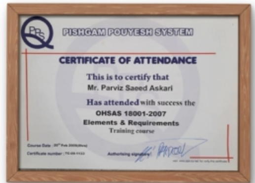
گواهینامه ی شرکت در دوره ی ایمنی OHSAS