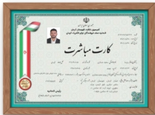
مجوز عمده فروشی لوازم الکتریکی ساختمان