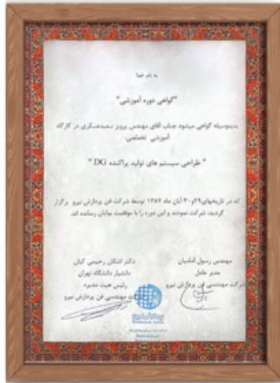
دوره آموزشی طراحی سیستم های تولید پراکنده (DG)