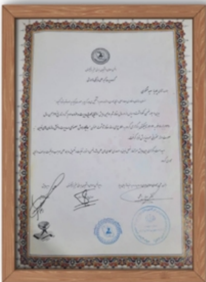
سخنرانی جایگاه هوش مصنوعی در مدیریت سازمان های نوین دانشگاه ملی تاجیکستان