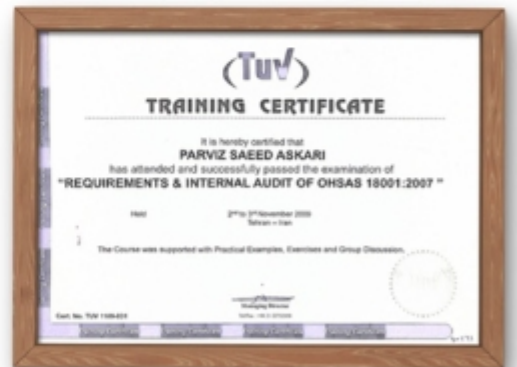
آزمون اخذ گواهینامه ایمنی OHSAS