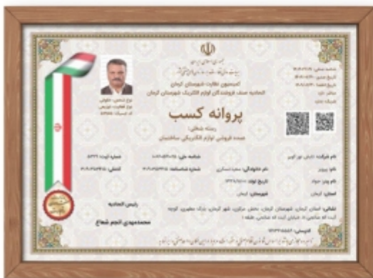
مجوز عمده فروشی لوازم الکتریکی ساختمان