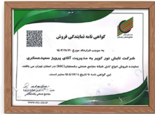
نماینده رسمی فروش کابل شبکه مجتمع صنعتی رفسنجان در استان تهران